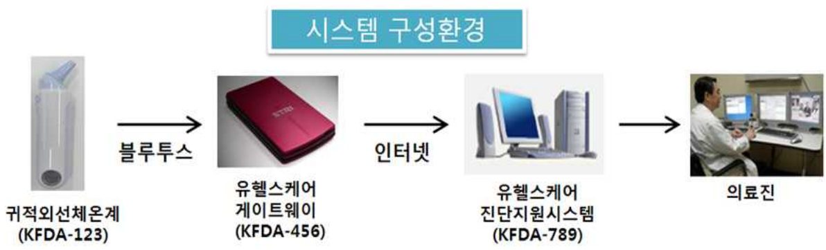
그림 6. 시스템 구성환경 작성의 예