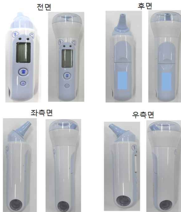
그림 3. 외관사진 작성의 예