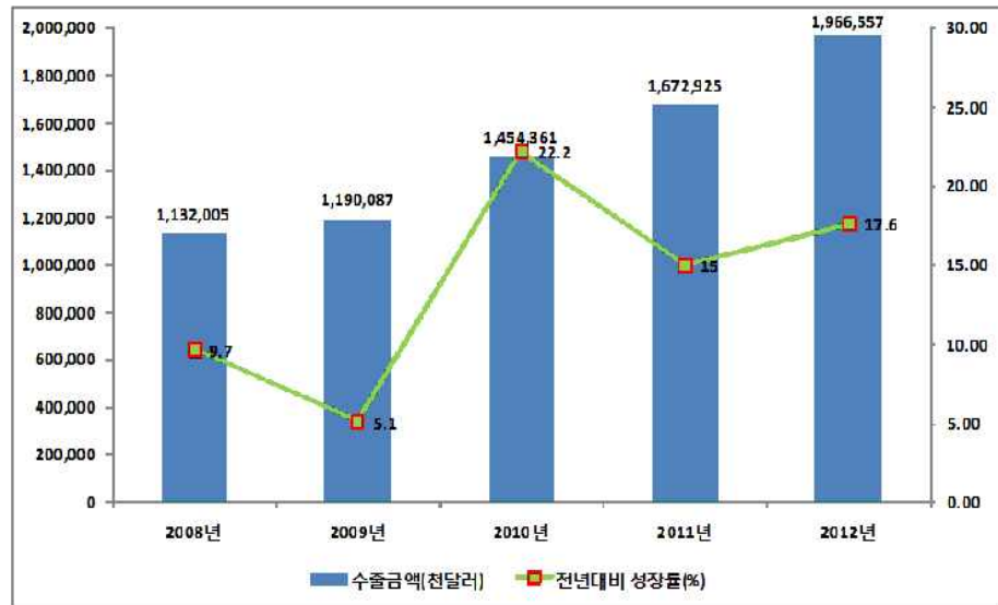
▲ 연도별 수출실적 현황