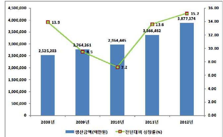
▲ 연도별 생산실적 현황