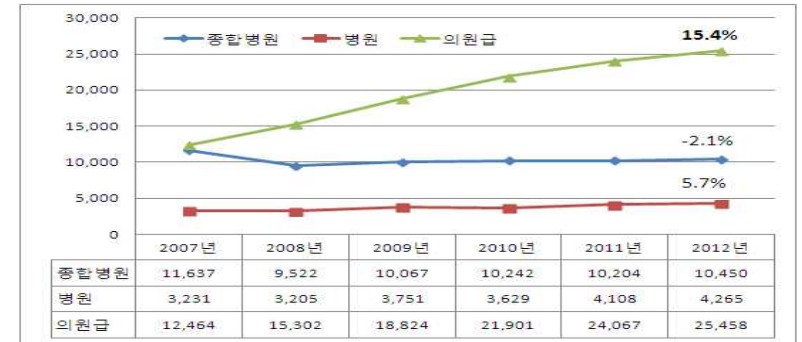
【 최근 6년간 ‘하지정맥류’ 입원 진료현황(명, %) 】