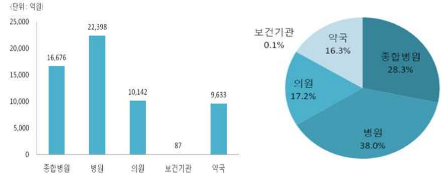
[2015년 의료급여기관 종별 급여비 및 점유율]

※ 병원은 치과병원 및 한방병원 포함, 의원은 치과의원 및 한의원, 조산원 포함 ※ 기관당 급여비 = 의료급여기관 종별 급여비 ÷ 연도 말 의료급여 기관수