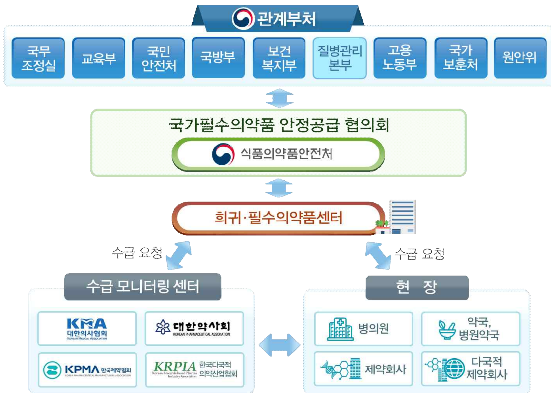
【그림 1 : 국가필수의약품 범부처 통합관리 시스템 모식도】