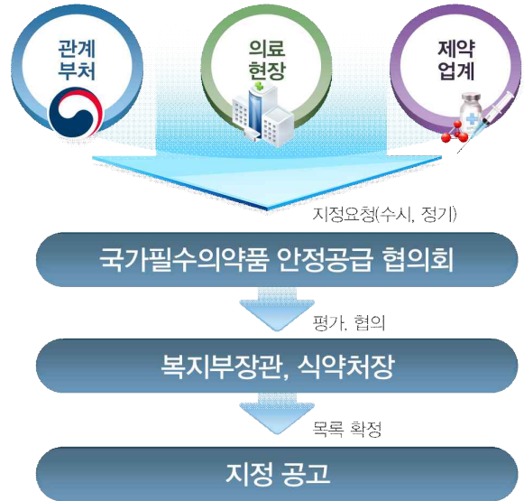
【그림 3 : 국가필수의약품 지정절차】