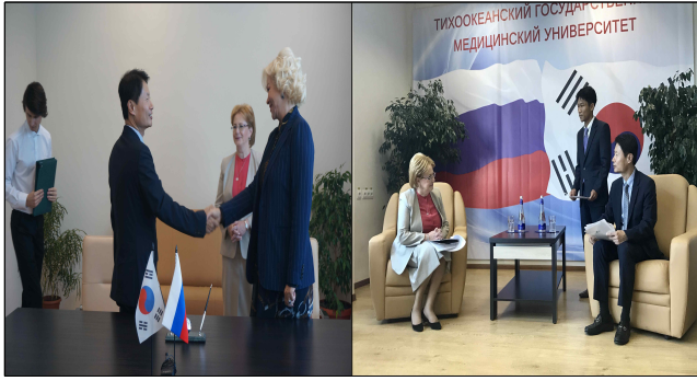
<한-러 의료인 연수 협력의향서 체결>