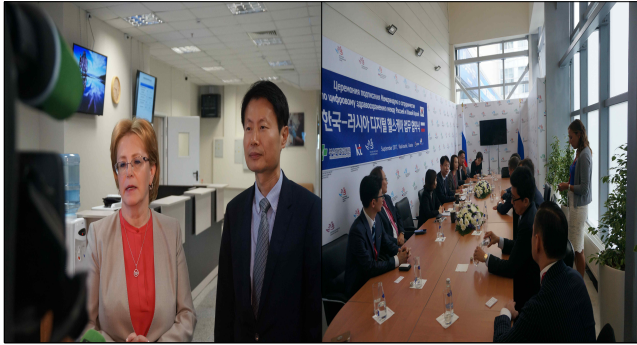
<현지 언론 인터뷰>